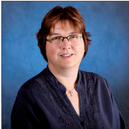
Heike Mühlbacher