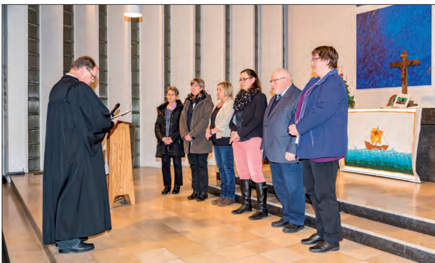
Ein guter Start: Einführung und Segnung des Gemeindebeirates im Gottesdienst zum Ehrenamtlichen-Empfang

Auch 2016 findet in der Johanneskirche am Ostersonntagmorgen eine Osternacht mit Abendmahl um 6.00 Uhr statt. Dieser Gottesdienst beginnt in Stille und Dunkelheit und führt über den Sonnenaufgang zum Licht. Im Anschluss an den Gottesdienst sind alle zu einem gemeinsamen und gemütlichen Osterfrühstück im Gemeindehaus eingeladen.