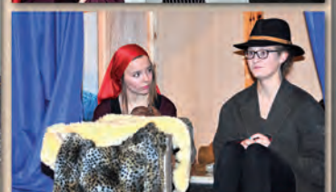
Krippenspiel Heiligabend 2015 um 16:30 Uhr

Weitere Fotos auf www.johanneskirche-lingen.de