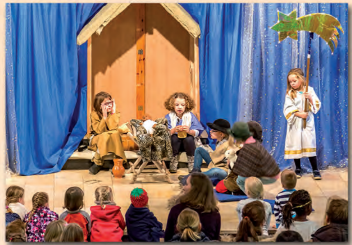
Krippenspiel Heiligabend 2015 um 15:00 Uhr