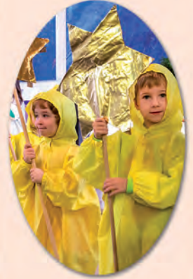
Familiengottesdienst am dritten Advent 2015 mit Kindern der KiTa Arche Noah