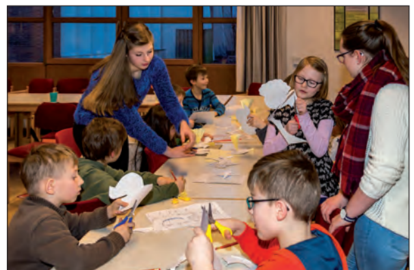
Die Konfi3-Kids haben viel Spaß beim Basteln.

Für alle Kinder, die neugierig geworden sind, besteht in Zukunft die Möglichkeit, im Jugendposaunenchor Lingen mitzuwirken. Hierfür wird in Kürze zusammen mit der Musikschule des Emslandes auch ein Ausbildungskurs unter professioneller Anleitung angeboten, dessen Kosten zur Hälfte durch die Kirchengemeinden übernommen werden! Dazu werden dann auch alle weiteren Infos verteilt.