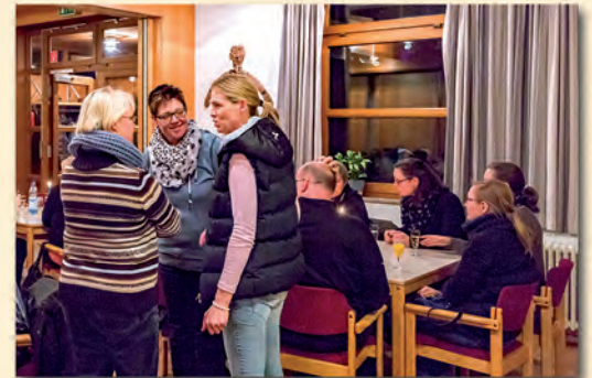
Ehrenamtlichenfest am 16. Januar 2016