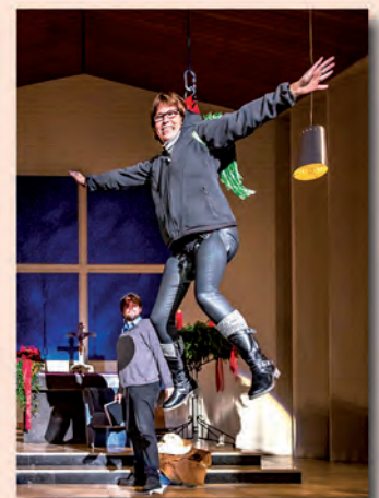
„Mittwochs in...“ am 16. Dezember 2015 Weitere Fotos auf www.johanneskirche-lingen.de