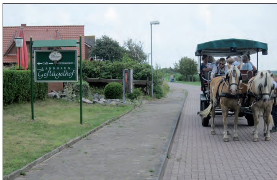
Borkum bietet vielfältige Möglichkeiten zur Erholung.

Oder im Gemeindebüro, Loosstraße 37, Tel. 0591/9150613