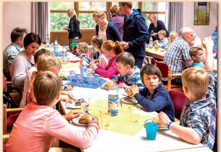
KU3-Abschlussgottesdienst am 12. Juli 2015