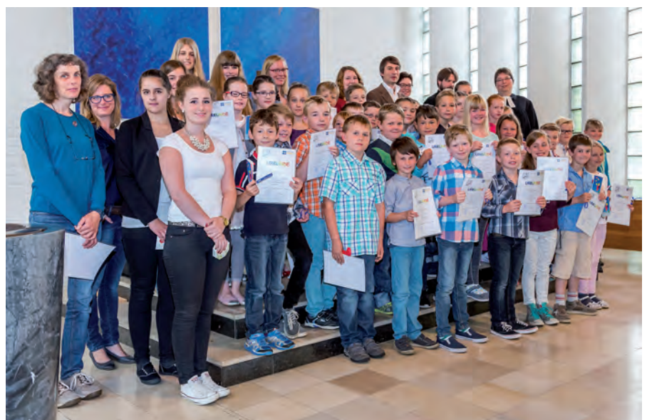
Die stolzen KU3-Kids mit ihren Urkunden.