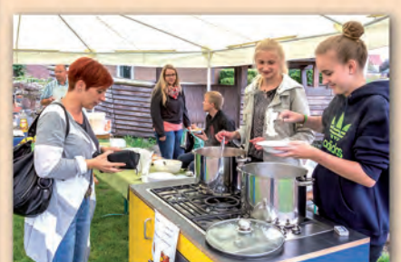
Gemeindefest mit Vorstellung der Vorkonfirmanden am 13. September 2015