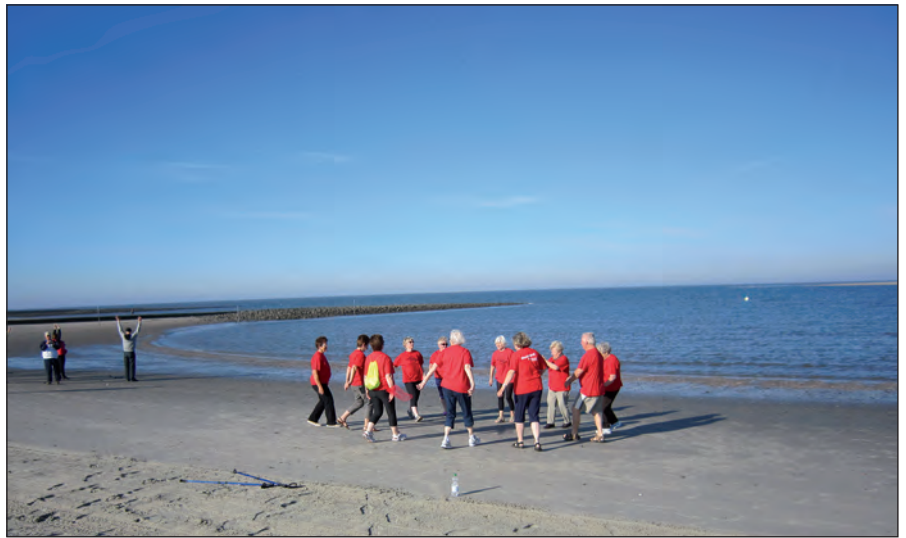
... Dünen, Strand, Wasser, gesunde Luft – besser kann man sich kaum erholen....

Wir laden ein, uns vom 4. bis 11. Juni zu begleiten. Die Kosten belaufen