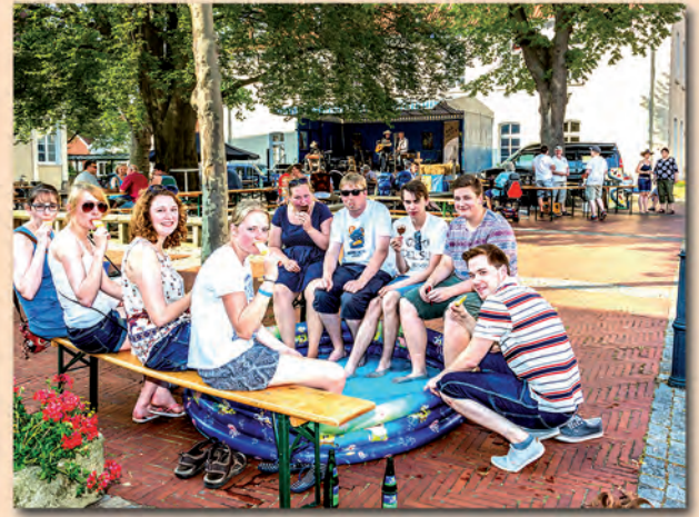
Western-Event am 4. Juli 2015