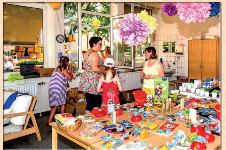
Sommerfest in der KiTa Arche Noah am 4. Juli 2015